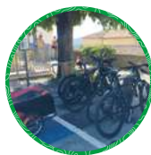
Fayence Place Léon Roux