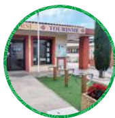
Montauroux Place du Clos