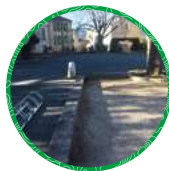
Saint-Paul-en-Forêt Place du champ de Foire