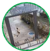
Bagnols-en-Forêt Place de la mairie