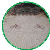
Tanneron Maison du Lac de Saint-Cassien Place de la Mairie